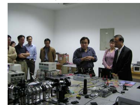
参观量子信息与物理实验室